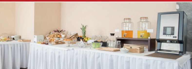
Dystrybutor Bravilor Bonamat

** Wielkość pojemników zależy od wersji urządzenia: 2,4 / 5,3 litra.