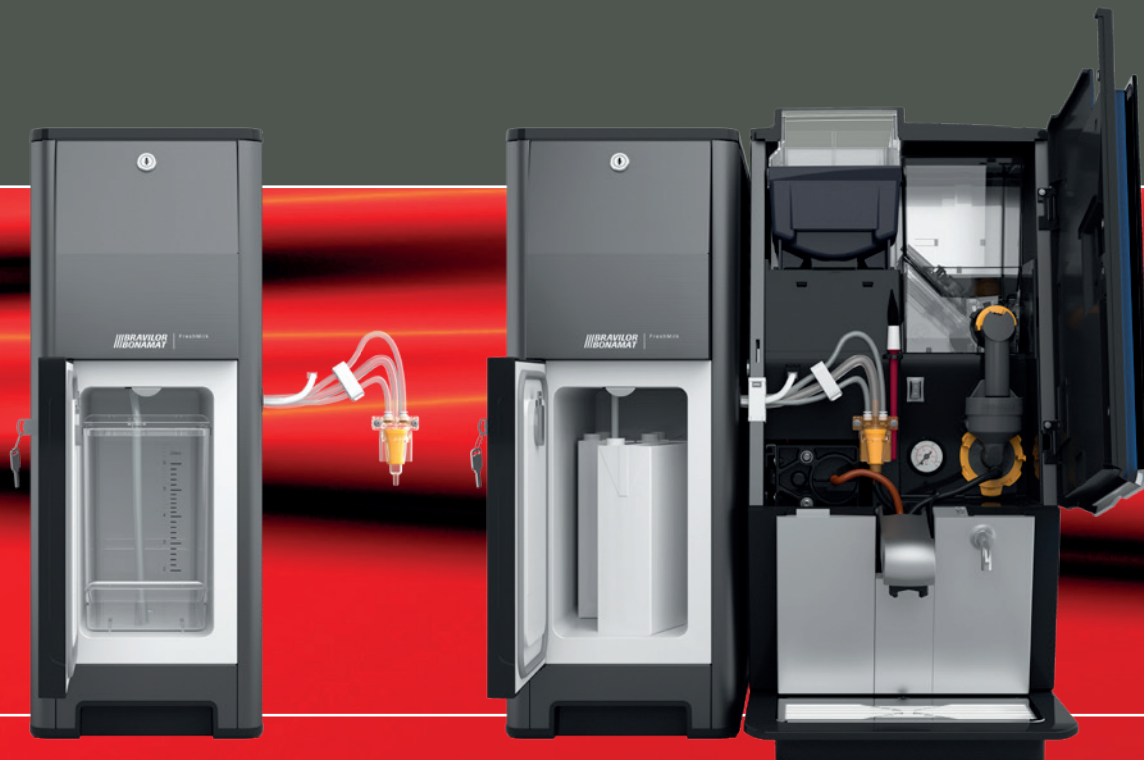
Ferskmelksløsning med beholder på 7 liter