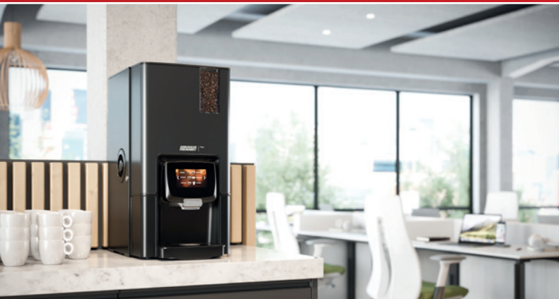
Din Bravilor Bonamat-återförsäljare

För mer information kan du kontakta Bravilor Bonamat direkt.