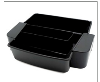
spillbrett for pidestall