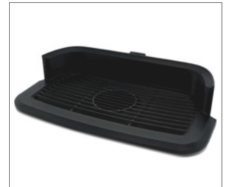
rist til spillbrett