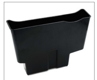
avfallsbøtte for pidestall