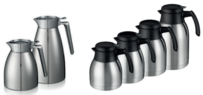
Qline kanner i rustfritt stål

Bravilor Bonamat leverer ulike termoskanner som bevarer temperaturen over lengre tid.